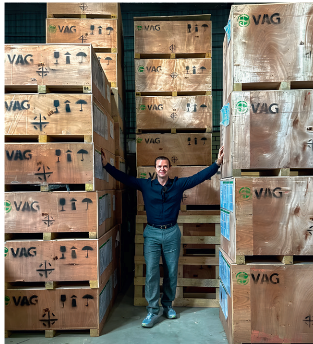
Склад VAG в Самаре

адаптируя под потребности и условия нашего направления. Все-таки такие сферы, как электроника, бытовая техника, автомобили, гораздо более прогрессивны с точки зрения методов продвижения, маркетинга, продаж и кадровой политики.