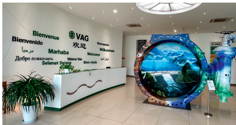
VAG Water Systems (Китай)

российского строительства поставка, например, щитовых затворов для очистных сооружений осуществляется всегда в последний момент. И сейчас благодаря тесному партнерству с российскими производителями мы делаем данную продукцию со сроком поставки в два раза ниже с сохранением всех технико-эксплуатационных параметров, характерных для продукции концерна VAG.