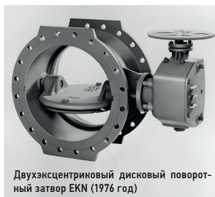
Двухэксцентриковый дисковый поворотный затвор EKN (1976 год)