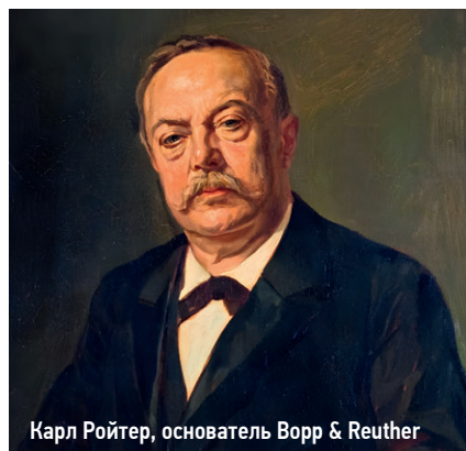
Карл Ройтер, основатель Bopp & Reuther

Да, логистический маршрут поставок стал немного длиннее, но мы стараемся создавать складские запасы на весь ассортимент продукции, чтобы сократить срок поставки. Мы стремимся заполнять свои склады на год вперед по стандартной складской программе – это типоразмеры от самых маленьких DN40 (для внутриквартальных сетей) до больших диаметров DN1400 мм, предназначенных для групповых водоводов.