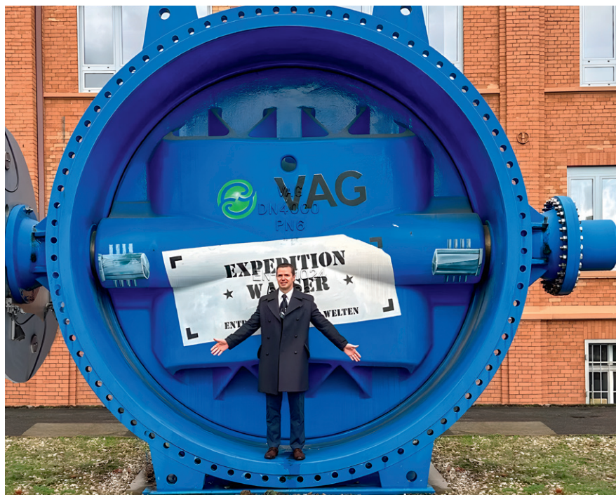
Крупнейший в мире затвор VAG EKN (DN 4000 мм)