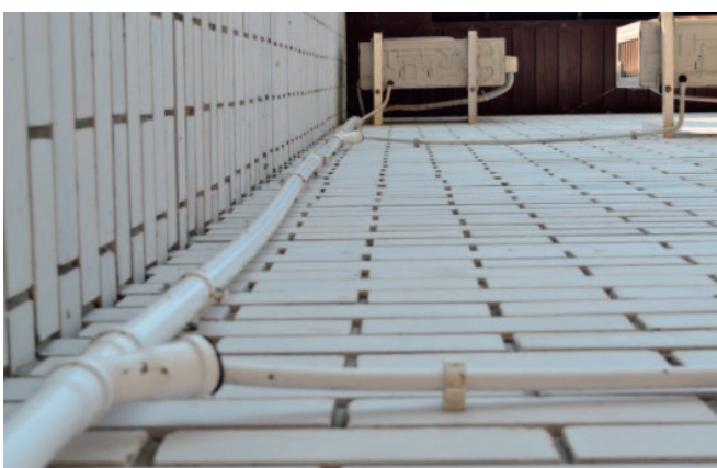
Рис. 6. Такого варианта отвода конденсата в СП нет

Обращаем внимание, что нормативы допускают прокладку стояков дренажа снаружи только в одном исполнении – в толщине утеплителя фасада, и только из чугунных труб с электрообогревом. Прокладку стояков в мокром фасаде или же по внешней стороне нормативная документация не предусматривает (рис. 6).