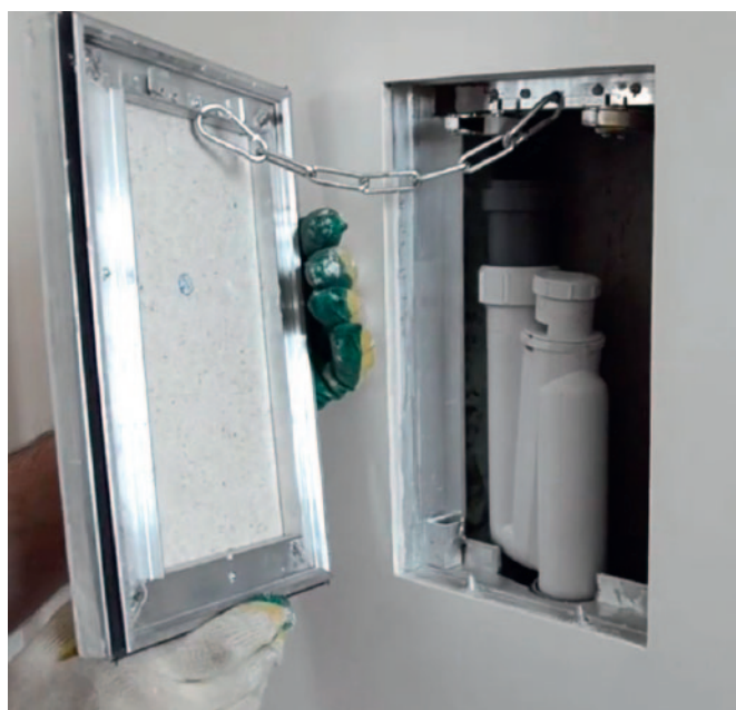
Рис. 3. Лючок напротив гидрозатвора при подключении к стояку

Если кондиционер работает на тепло при уличной температуре ниже 0 °С, то влага