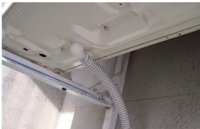
Рис. 5. Слив воды из наружного блока в дренажную систему

(конденсат), выступающая на очень холодном теплообменнике наружного блока, замерзает, покрывая его ледяной коркой (рис. 4).