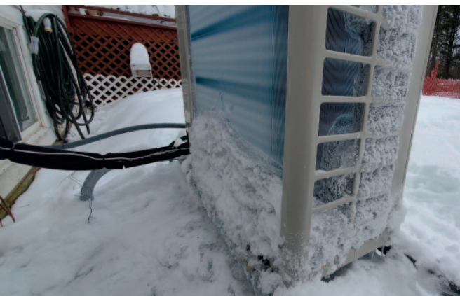
Рис. 4. Наружный блок с замерзшим теплообменником